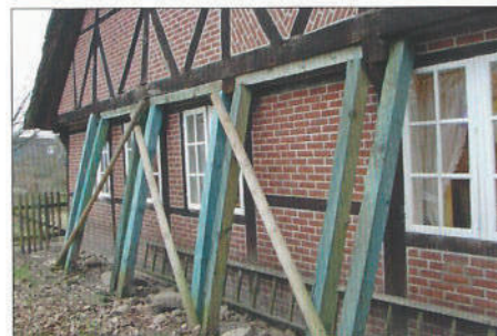
Bausünden aus den 1960er Jahren: Die rückwärtige Wand des Spiekerhus drohte abzurutschen und musste gestützt werden.

lichst zahlreicher und zahlungskräf- tiger Stifter.