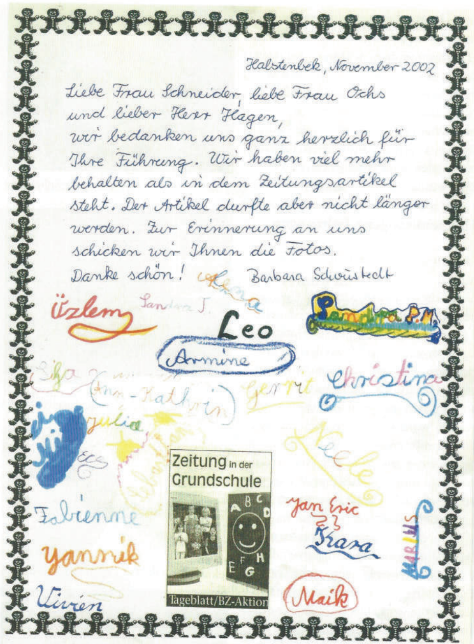
Dankesbrief der Klassen 3a und 3b der Grundschule Halstenbek