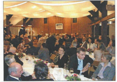
2009 Waldherrenmahl im Beyle-Saal (im Spiekerhus) vor dem Rückbau des Hauses

Ole von Beust in seiner lebenslangen Verbundenheit mit den Walddörfern genoss den Abend, zu dem er verspätet aus einer Krisensitzung der HSH Nordbank erschienen war. Ihm folgten (2010) Anja Hajduk und (2011) der (wegen der vorgezogenen