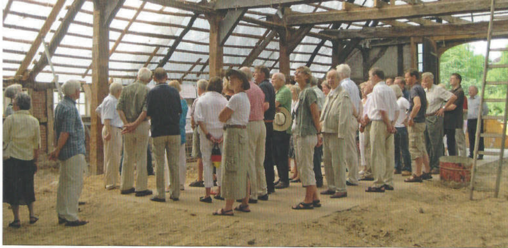
Stiftertreffen auf der Baustelle im Spiekerhus im Juli 2010